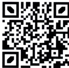
QR Code กรอกข้อมูล

หมายเหตุ ให้ผู้ที่รายงานตัวและยืนยันสิทธิ์การเข้าเรียนแล้วดำเนินการกรอกข้อมูลเพื่อใช้ในการมอบตัว และทำสัญญาการเป็นนักเรียนโรงเรียนวิทยาศาสตร์จุฬาราชวิทยาลัย กำแพงเพชร ระดับชั้นมัธยมศึกษาตอนปลาย ปีการศึกษา 2567 ที่เว็บไซต์ https://ad.pcschs.ac.th/regis/